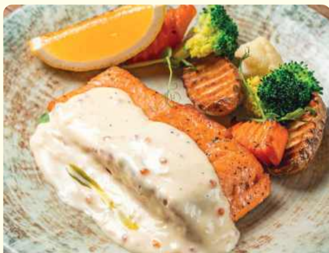
Форель с овощами