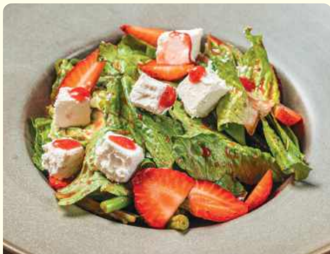
Салат с клубникой и сыром фета