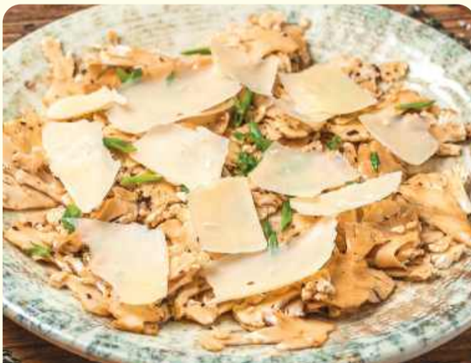
Карпачо из цветной капусты