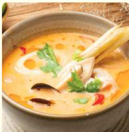
Суп Том ям