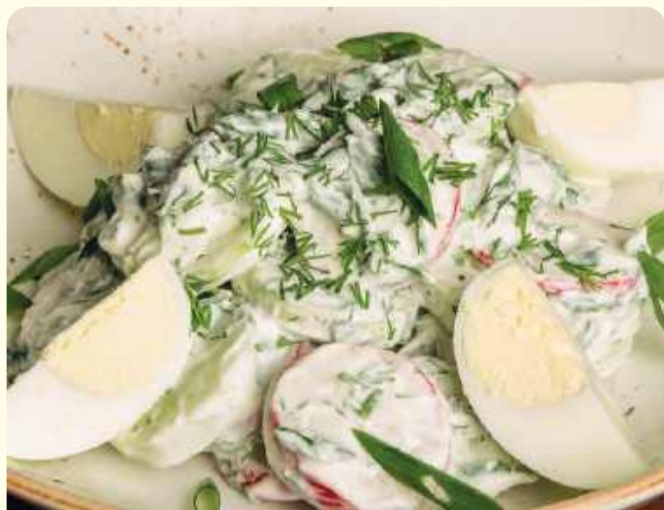
Салат с грядки