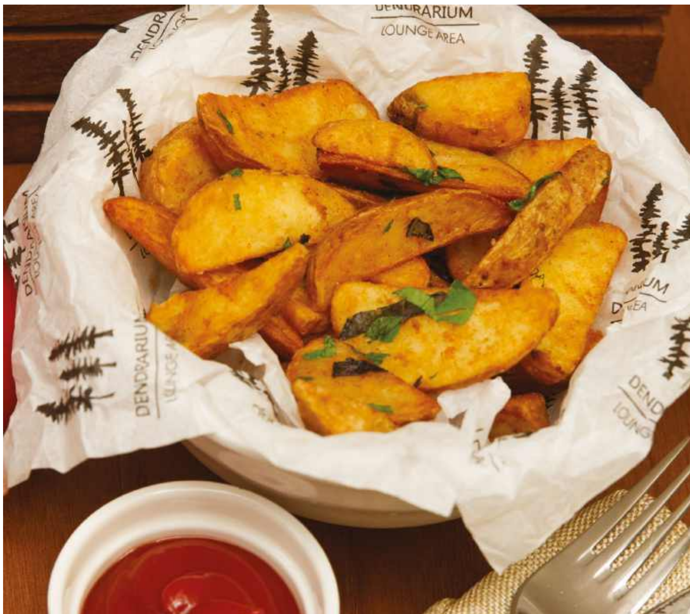
РИС ДИКИЙ 250 Р 150гр