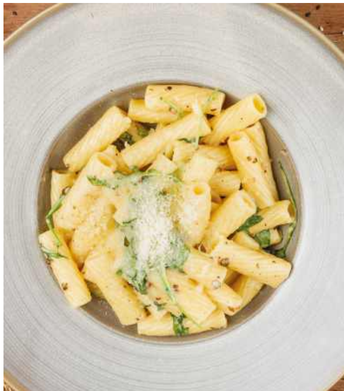
РИГАТОНИ С КОПЧЕНОЙ КУРИЦЕЙ 550 Р 280гр