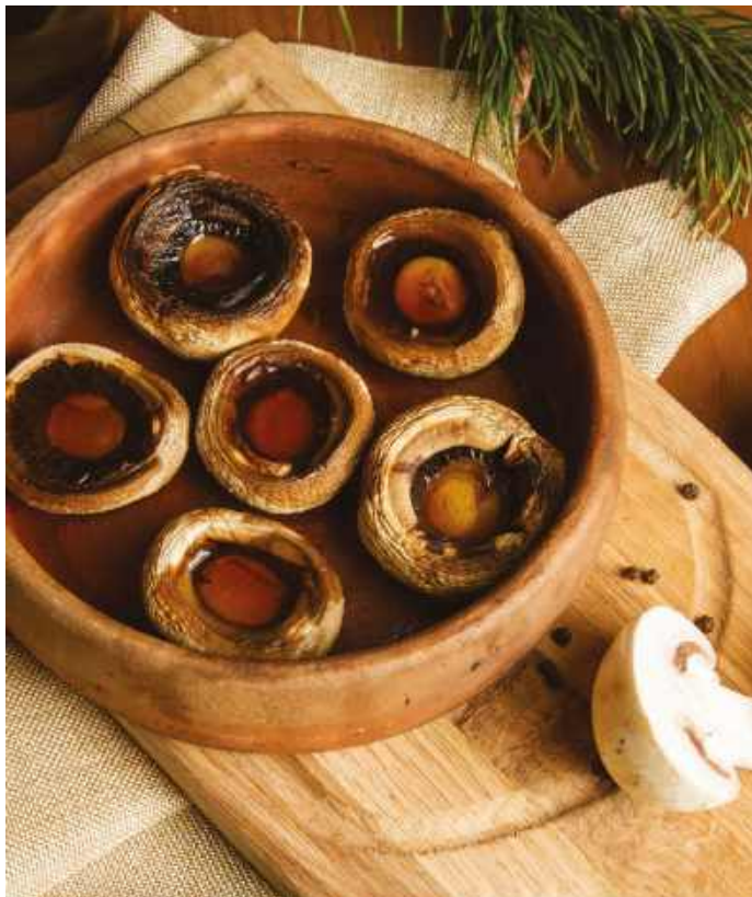
ШАМПИНЬОНЫ В СОБСТВЕННОМ СОКУ