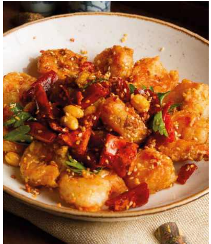
КРЕВЕТКИ В СОУСЕ ЧИЛИ 1350 Р 230гр