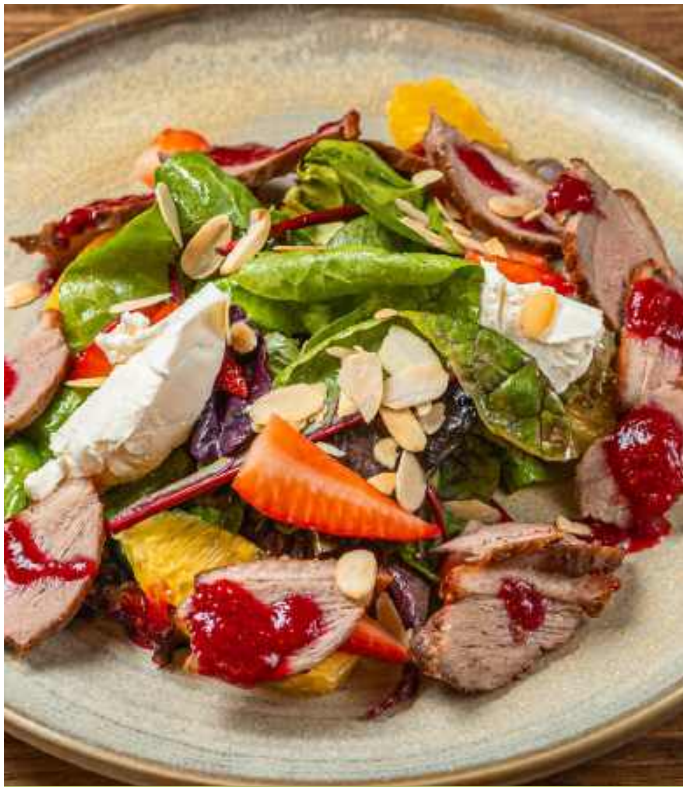
САЛАТ ИЗ УТИНОЙ ГРУДКИ