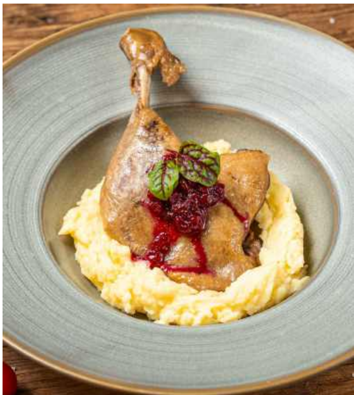
УТИНАЯ НОЖКА КОНФИ С ПЮРЕ И БРУСНИЧНЫМ СОУСОМ 850 Р 330гр

DUCK LEG CONFIT WITH MASHED POTATOES AND LINGONBERRY SAUCE