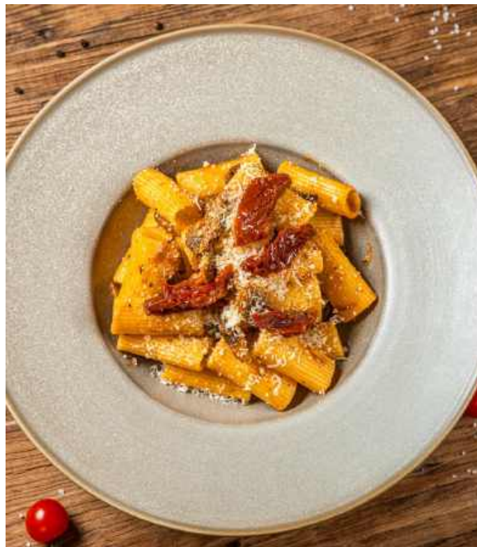
РИГАТОНИ С РВАННОЙ ГОВЯДИНОЙ 850 Р 330гр