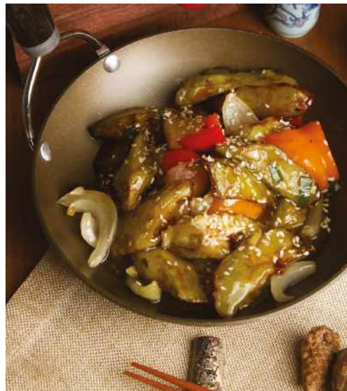
БАКЛАЖАНЫ В ЧЕСНОЧНОМ СОУСЕ