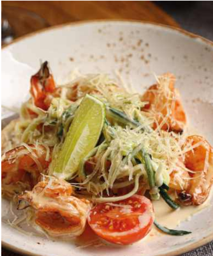
КРЕВЕТКИ В СЛИВОЧНОМ СОУСЕ 1350 Р 200гр