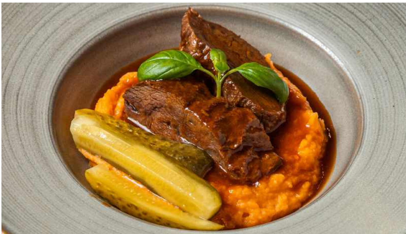
ЩЕЧКИ ГОВЯЖЬИ С ПЮРЕ ИЗ БАТАТА