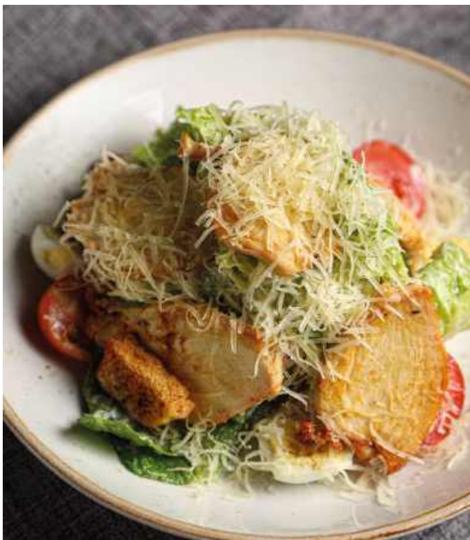
ЦЕЗАРЬ С КУРИЦЕЙ