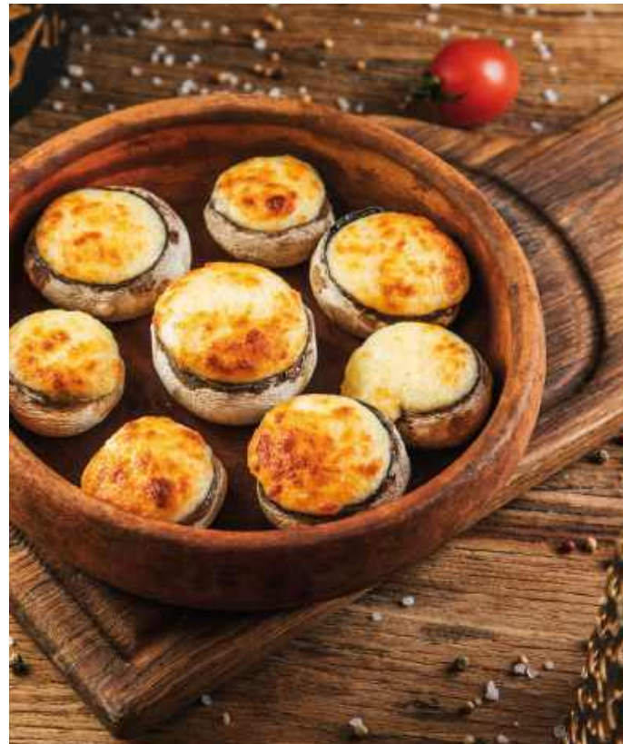
ШАМПИНЬОНЫ ПОД СЫРНОЙ КОРОЧКОЙ