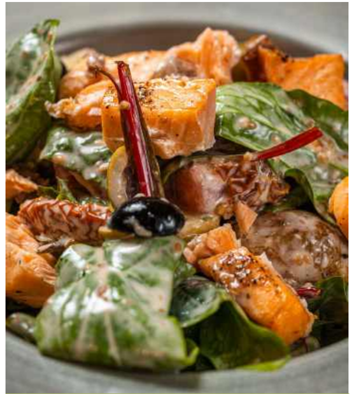
САЛАТ С ЛОСОСЕМ