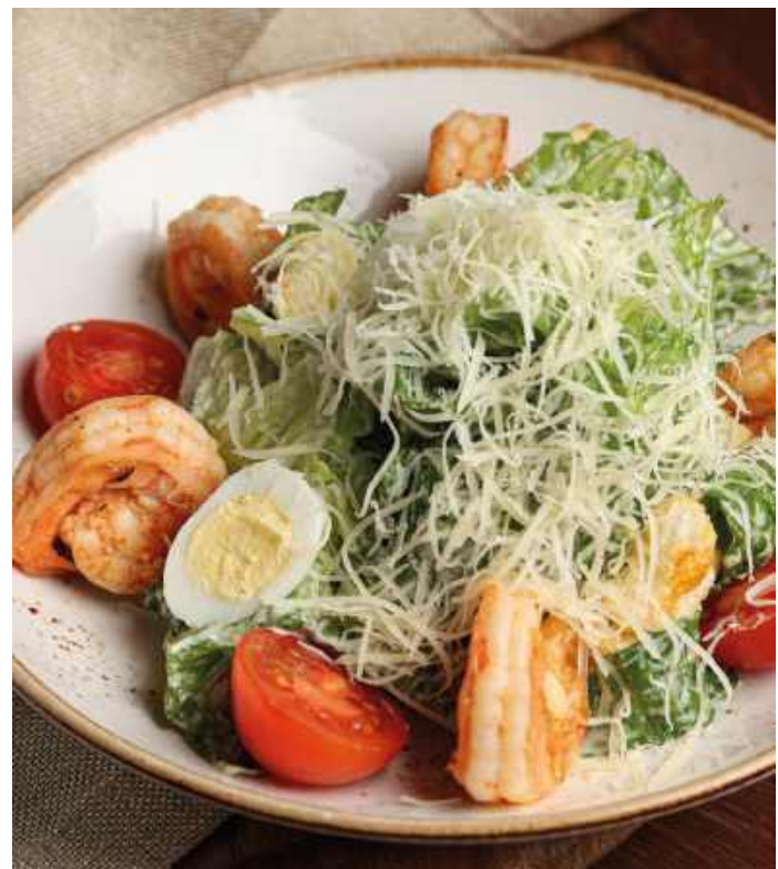
ЦЕЗАРЬ С КРЕВЕТКАМИ