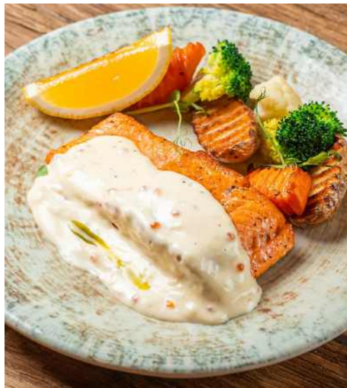
СТЕЙК ФОРЕЛИ С ОВОЩАМИ 850 Р 390гр

DUCK LEG CONFIT WITH MASHED POTATOES AND LINGONBERRY SAUCE