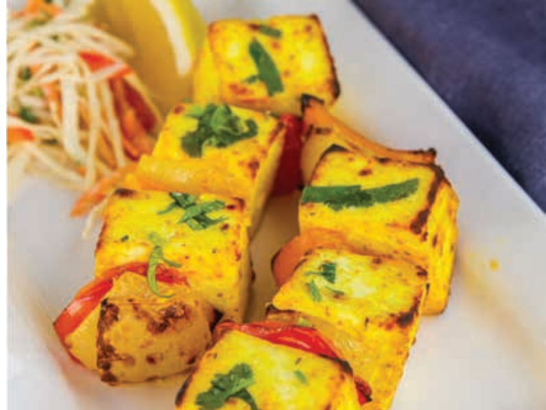
ЗАПЕЧЕННЫЙ СЫР В ТАНДЫРЕ (ИНДИЯ) ■ 240 Домашний сыр, лук репчатый, индийские специи