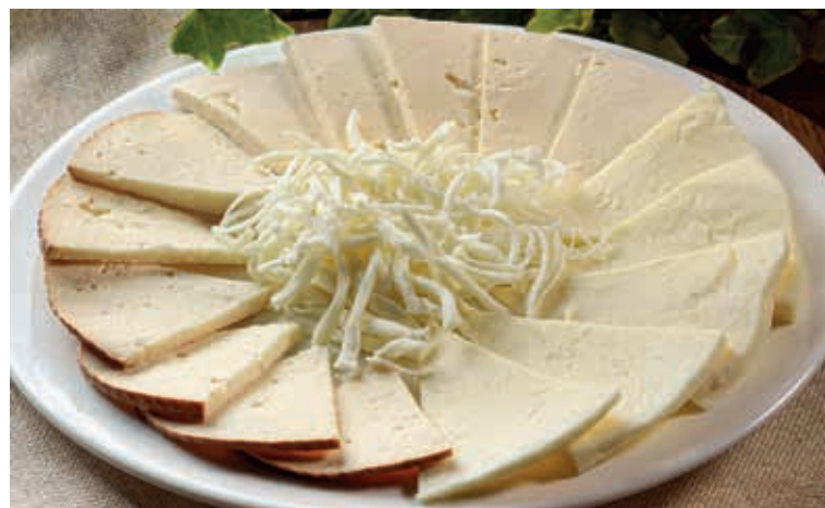
ПЛАТО ИЗ КАВКАЗСКИХ СЫРОВ ■ 280/30

Сулугуни, чечил, осетинский сыр, копченый сулугуни