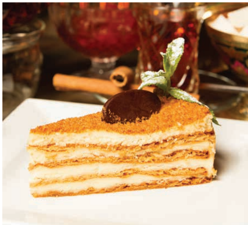
МЕДОВИК ■ 115 Медовые коржи, сметанный соус