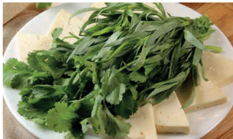
СЫР ОСЕТИНСКИЙ С ЗЕЛЕНЬЮ ■ 200/60