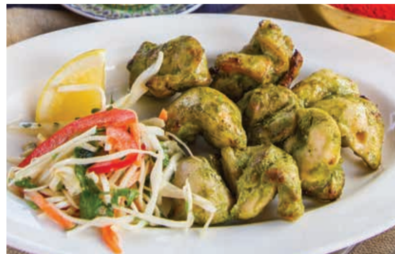
ШАШЛЫК ИЗ КУРИЦЫ В МЯТНОМ СОУСЕ (ИНДИЯ) ■ 170/50

Мясо курицы, орешки кешью, перец чили, йогурт, мятная мука, кориандр