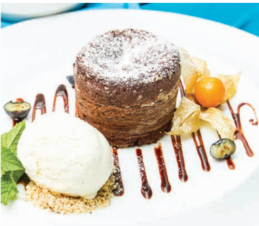
ШОКОЛАДНЫЙ ФОНДАН ■ 80/50 CHOCOLATE FONDUE