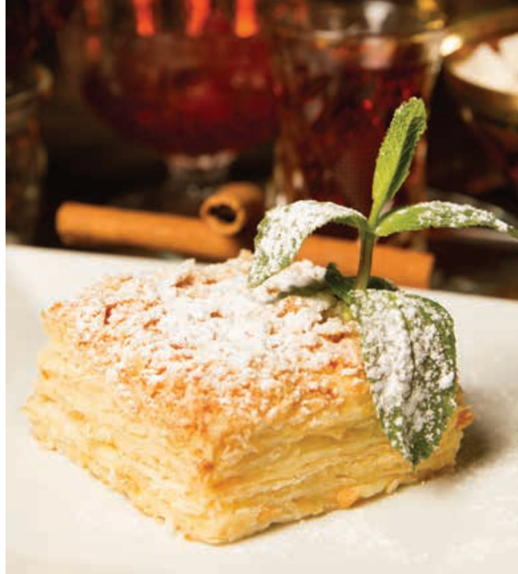
ДОМАШНИЙ НАПОЛЕОН ■ 145 Слоеное тесто, сгущенное молоко