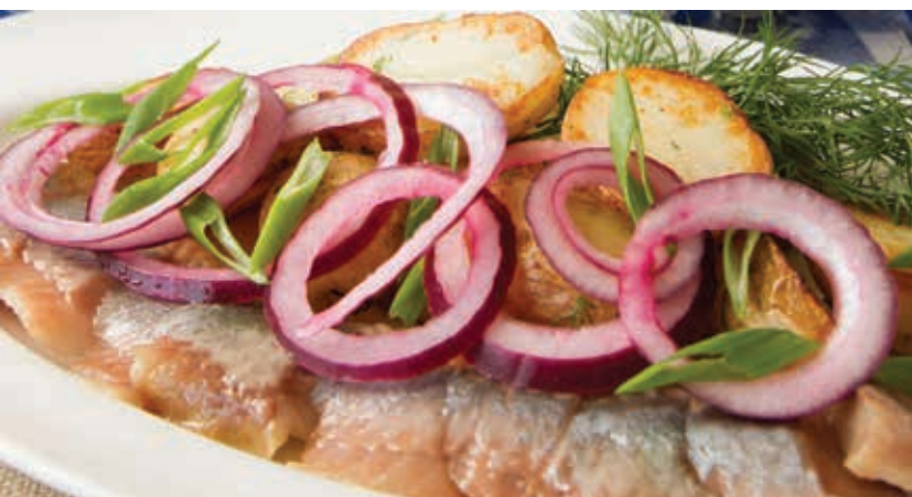
ФИЛЕ СЕЛЬДИ С ЗАПЕЧЕННЫМ КАРТОФЕЛЕМ И КРАСНЫМ ЛУКОМ ■ 270 Балтийская сельдь, мини картофель, красный лук

Basturma, beef tongue, chicken roll, spicy beef