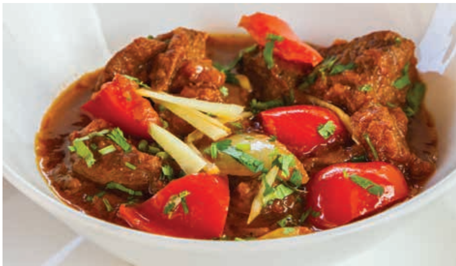
БАРАНИНА С ОВОЩАМИ (ИНДИЯ) ■ 250 Баранина, томаты, перец чили, специи