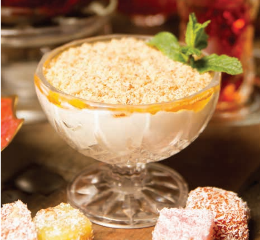
МАЦОНИ С МЕДОМ И ГРЕЦКИМ ОРЕХОМ ■ 240 Мацони, грецкий орех, мед