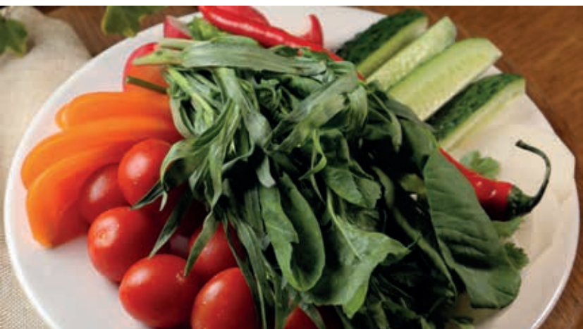
СЕЗОННЫЕ ОВОЩИ И ЗЕЛЕНЬ ■ 570

Огурцы, томаты, болгарский перец, редис, перец чили, кресс-салат, тархун, кинза