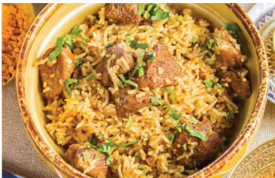
ПЛОВ ИНДИЙСКИЙ С БАРАНИНОЙ ■ 300 Рис, баранина, лук, специи

Chicken, cashew, chili pepper, yoghurt, mint flour, coriander