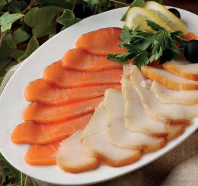
РЫБНОЕ РАЗДОЛЬЕ ■ 300/35 Семга слабосоленая, масляная рыба