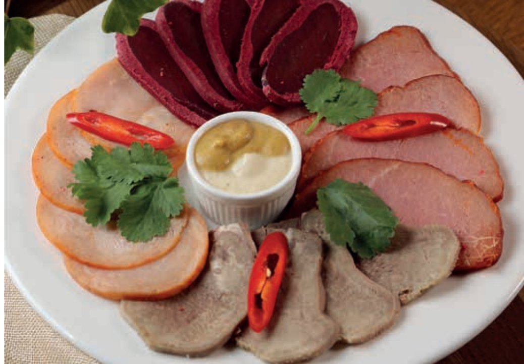
МЯСНОЕ АССОРТИ ■ 200/50

Бастурма, говяжий язык, куриный рулет, пряная говядина