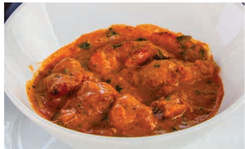
КУРИЦА В ТОМАТНОМ СОУСЕ (ИНДИЯ) ■ 280

Мясо курицы, лук репчатый, томаты, специи