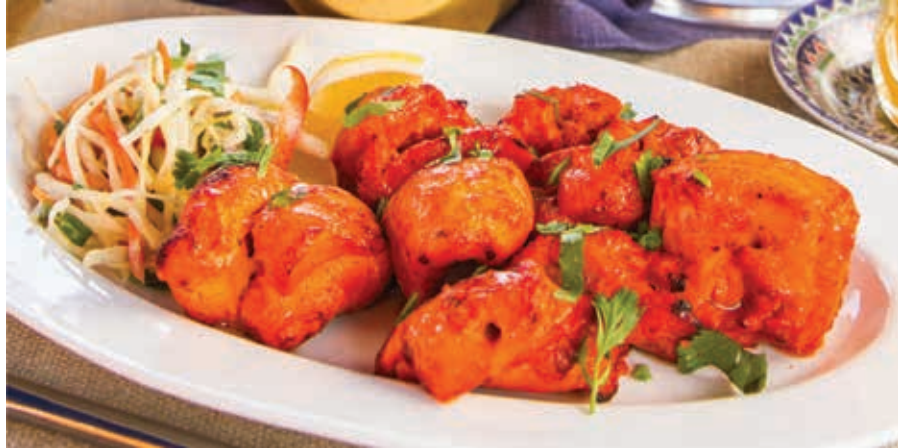
ШАШЛЫК ИЗ КУРИЦЫ «МУРГ ТИККА» (ИНДИЯ) ■ 170/50 Мясо курицы, индийские специи